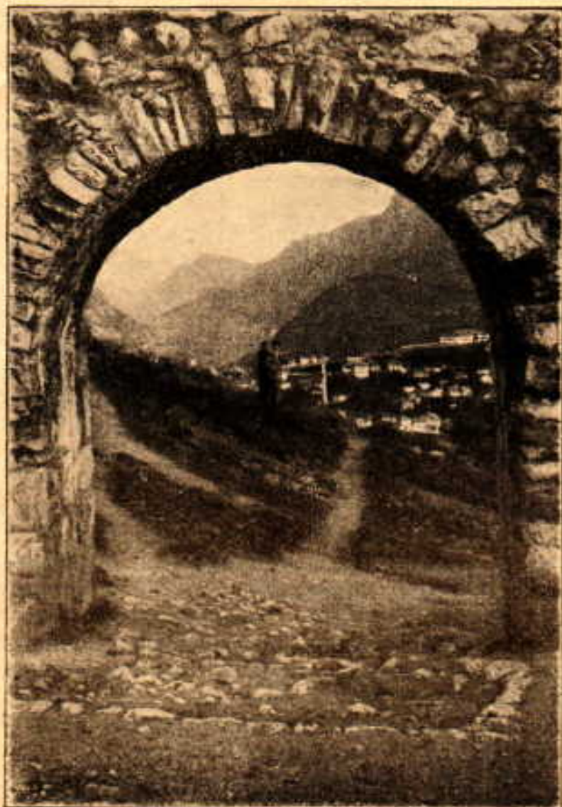
Улаз у град са источне стране

У 14 и 15 вијеку Врхбосна је била у власти моћних кнезова рогатичког Борча, кнезова Радјена Јабланића и сина му Павла, а послије Павлова сина, великог војводе Радосава